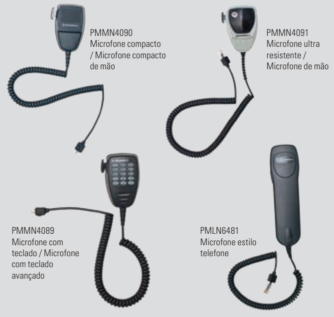
PMMN4090 Microfone compacto / Microfone compacto de mão